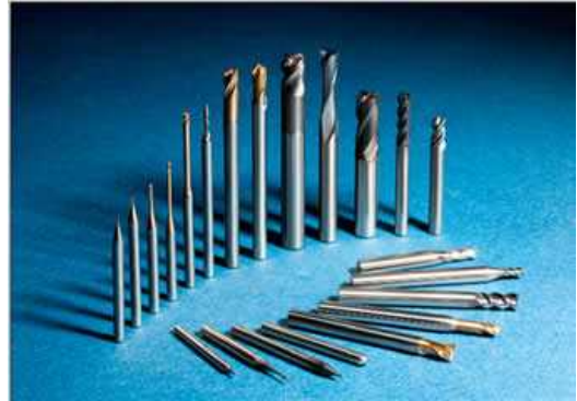
※写真はイメージであり、一部対象外の商品もございます

昨秋ご好評を頂いた、ユニオンツールのプラス1キャンペーンが帰ってきました。既に3月2日よりスタートしており、期間は4月17日までとなります。今回は、下記対象商品を5本お買い上げで1本無料サービス致します。ご購入頂く本数が多いと、無料サービス分も比例して増えていきます(例:10本購入で2本無料、15本購入で3本無料...)ので、まとめ買いの絶好のチャンスです。お忘れの無いよう、お申し込みはお早めにごうぞ!!